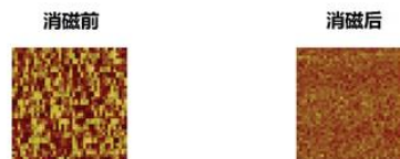
MFM 测试结果 (磁场强度显微测试)

介质: 2.5" Hitachi 垂直写入式硬盘 型号: HGST-HTS545050B9A300 矫顽力估值: 7,000 Oe