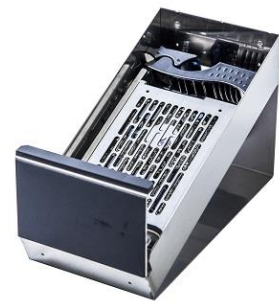
倾斜介质托盘 (美国专利号码: US20120327530)